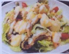
シーフードサラダ