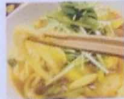
チキンスープ かしーうとれ 890円(961)