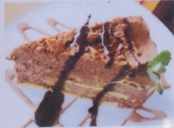
チョコバナナケーキ

ケーキはスタッフが愛情を込めて1つ1つ手作りしています。 お持ち帰りもできますよ♪