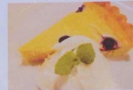
ブルーベリーチーズタルト