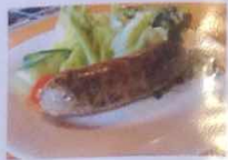
ハーブソーセージ