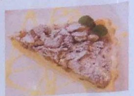
鬼ぐるみのタルト