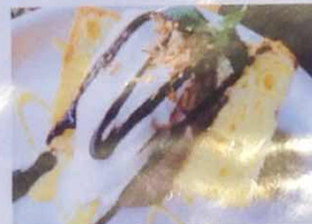
パニラシフォンケーキ