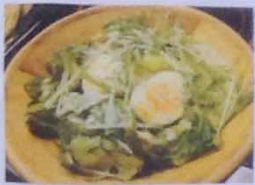
シーマーズサラダ