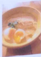
魚煮のたまご付き 1050円(1134)