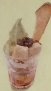
黒蜜きなこパフェ 407円(税込440円)