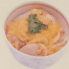
ミニ親子丼 500円 (税込540円)