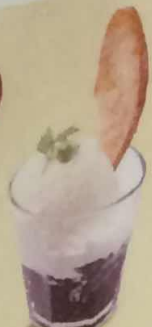
ブラウニーパフェ 388円(税込420円)