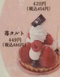
莓タルト 449円(税込486円)