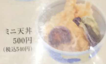
ミニ天丼 500円 (税込540円)