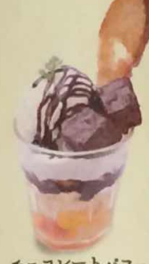
チョコレートパフェ 435円(税込470円)