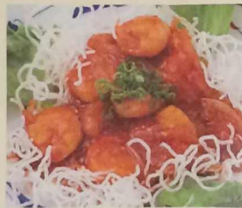
ぷりぷりエビの チリソース定食