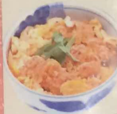
ミニカツ丼 500円 (税込540円)

ミニサイズの丼ぶりメニューやうどん・そばを、好きな おかずメニューと組み合わせて、自分だけの定食を作ってみては?