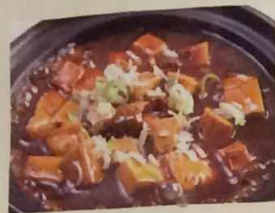
ピリ辛麻婆豆腐定食 ピリ辛 (単品: 税込530円) 653円 (税込710円)