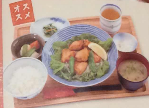
チキンからあげ定食