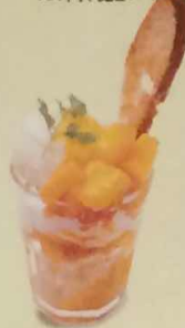
マンゴパフェ 462円(税込500円)