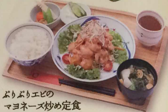
ぷりぷりエビの マヨネーズ炒め定食