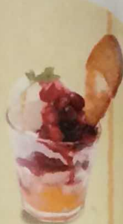
ベリーベリーパフェ 481円(税込520円)