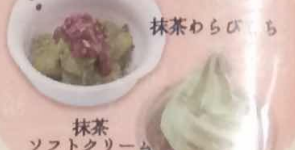
抹茶ソフトクリーム