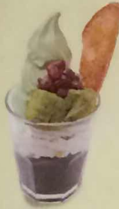
抹茶ゼリーパフェ 435円(税込470円)