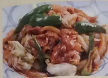
★イコロー 回鍋肉定食 (単品: 税込650円) 790円 (税込830円)