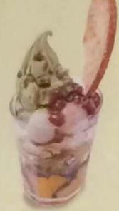
白玉大納言パフェ 407円(税込440円)