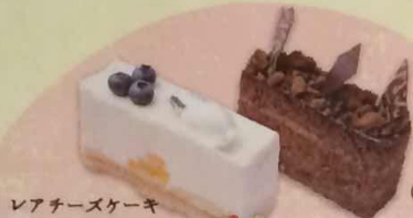
レアチーズケーキ 420円(税込454円)

(税込420円~) どれにしようか迷っちゃうくらいバラエティ豊富なパフェが勢ぞろい!