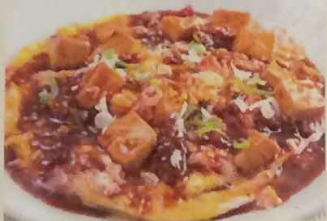
とろとろかに玉の ピリ辛 麻婆あんかけ定食 (単品: 税込630円) 750円 (税込810円)