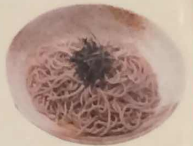
ざるそば 又はうどん 306円 (税込330円)