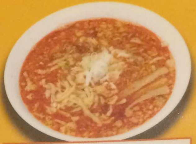
タンタンメン 620円 (税込)