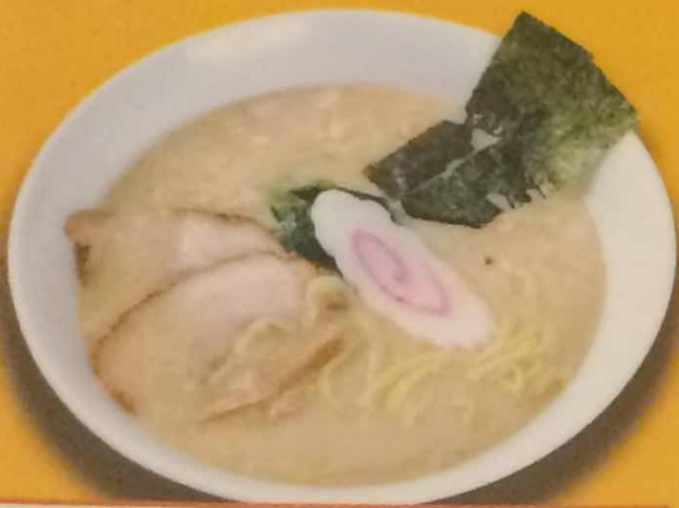
とんこつラーメン 620円 (税込)