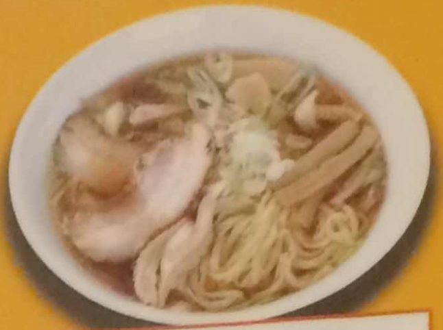
きのこラーメン 750円(税込)