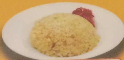
チャーハン 550円(税込)