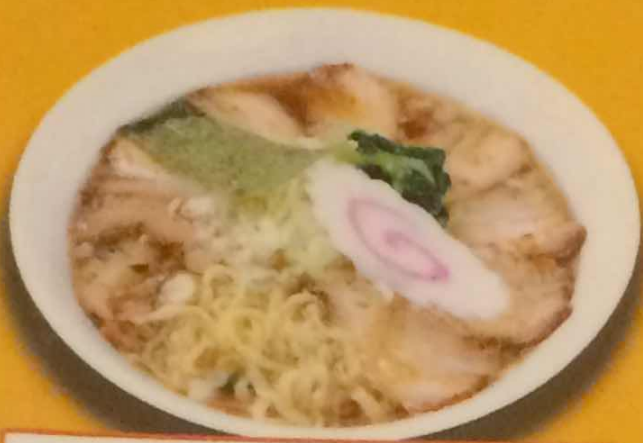
チャーシューメン 900円 (税込)