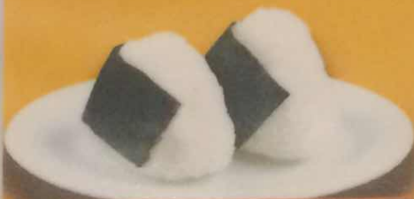
おにぎり(2個) 250円(税込)

※ラーメンは、大盛り+200円・小盛り-50円で分量を変更出来ます。 ※麺は「細麺」と「太麺」からお選び下さい。 ※スープは「あっさり味」と「こってり味」からお選び下さい。