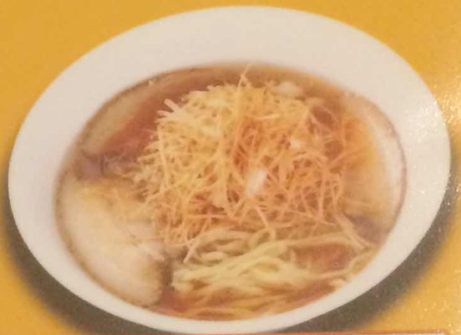
激辛ネギラーメン 800円 (税込)

※ラーメンは、大盛り+200円・小盛り-50円で分量を変更出来ます。 ※麺は「細麺」と「太麺」からお選び下さい。 ※スープは「あっさり味」と「こってり味」からお選び下さい。