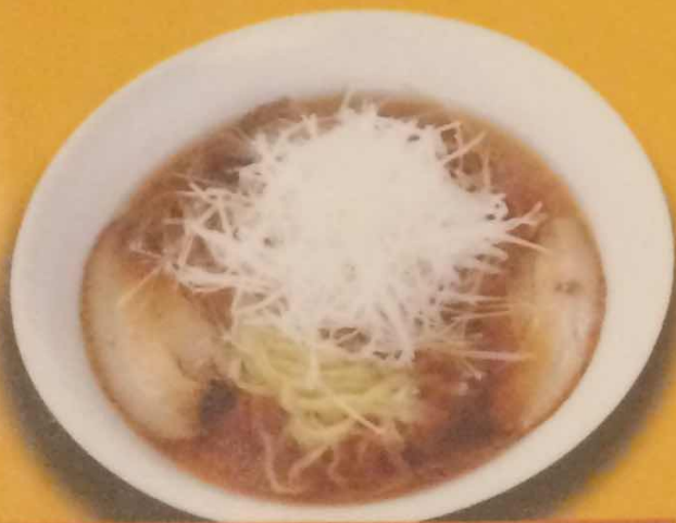
ネギラーメン 800円 (税込)