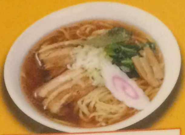
角煮ラーメン 1050円 (税込)