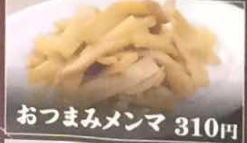
おつまみメンマ 310円