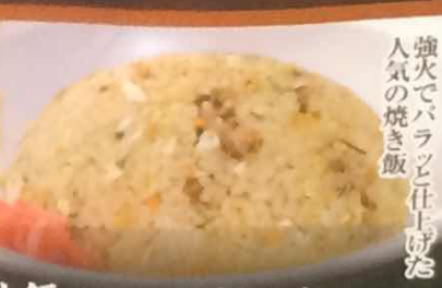
炒飯 520円 炒飯小盛 450円