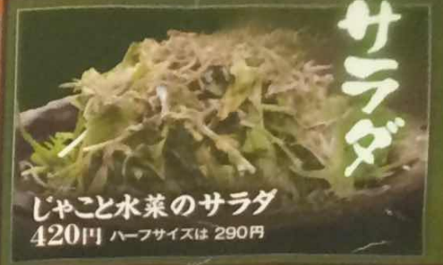
じゃこと水菜のサラダ 420円 ハーフサイズは 290円