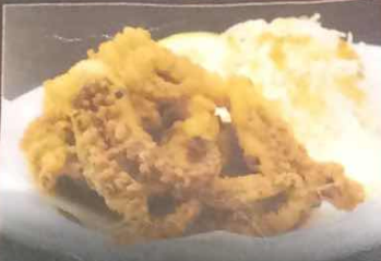
イカげそ唐揚げ 390円