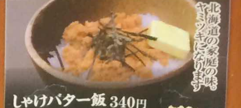
しゃけバター飯 340円