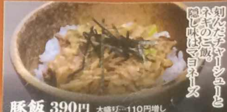
豚飯 390円 大盛り...110円増し