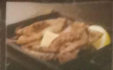
げそバター炒め 420円