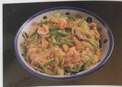
はるさめ野菜ミックス