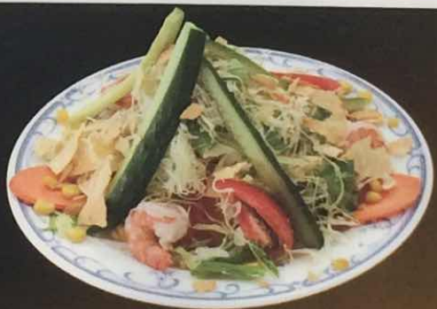
ガンジスペシャルサラダ