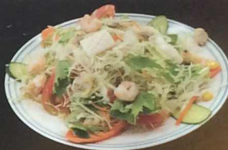
シーフードサラダ