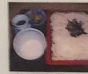
山ざるうどん そば 850円