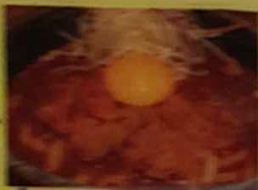
かき入りのカレーうどんもおすすめ!