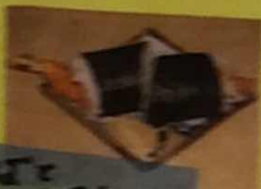
うどんそばとご一緒に!