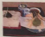
天ざるうどん そば 1400円