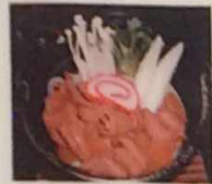
もつ煮込みうどん 800円